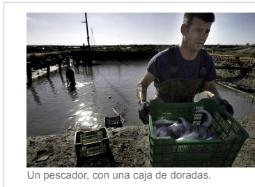
Un pescador, con una caja de doradas.